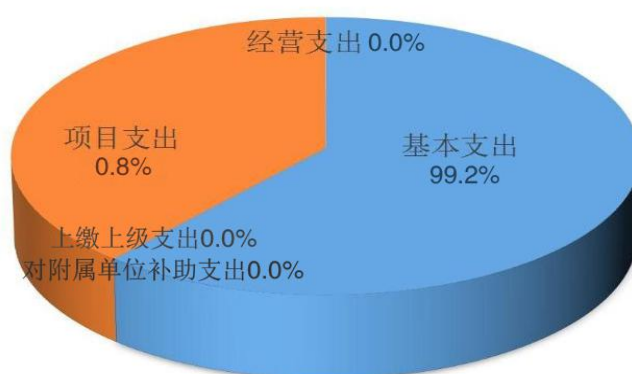
图 2：支出决算构成情况（按支出性质）

本部门 2021 年度支出合计 3281.82 万元，其中：基本支出 3256.82 万元，占 99.2%；项目支出 25 万元，占 0.8%；上缴上级支出 0 万元，占 0.0%；经营支出 0 万元，占 0.0%；对附属单位补助支出 0 万元，占 0.0%。如图所示：